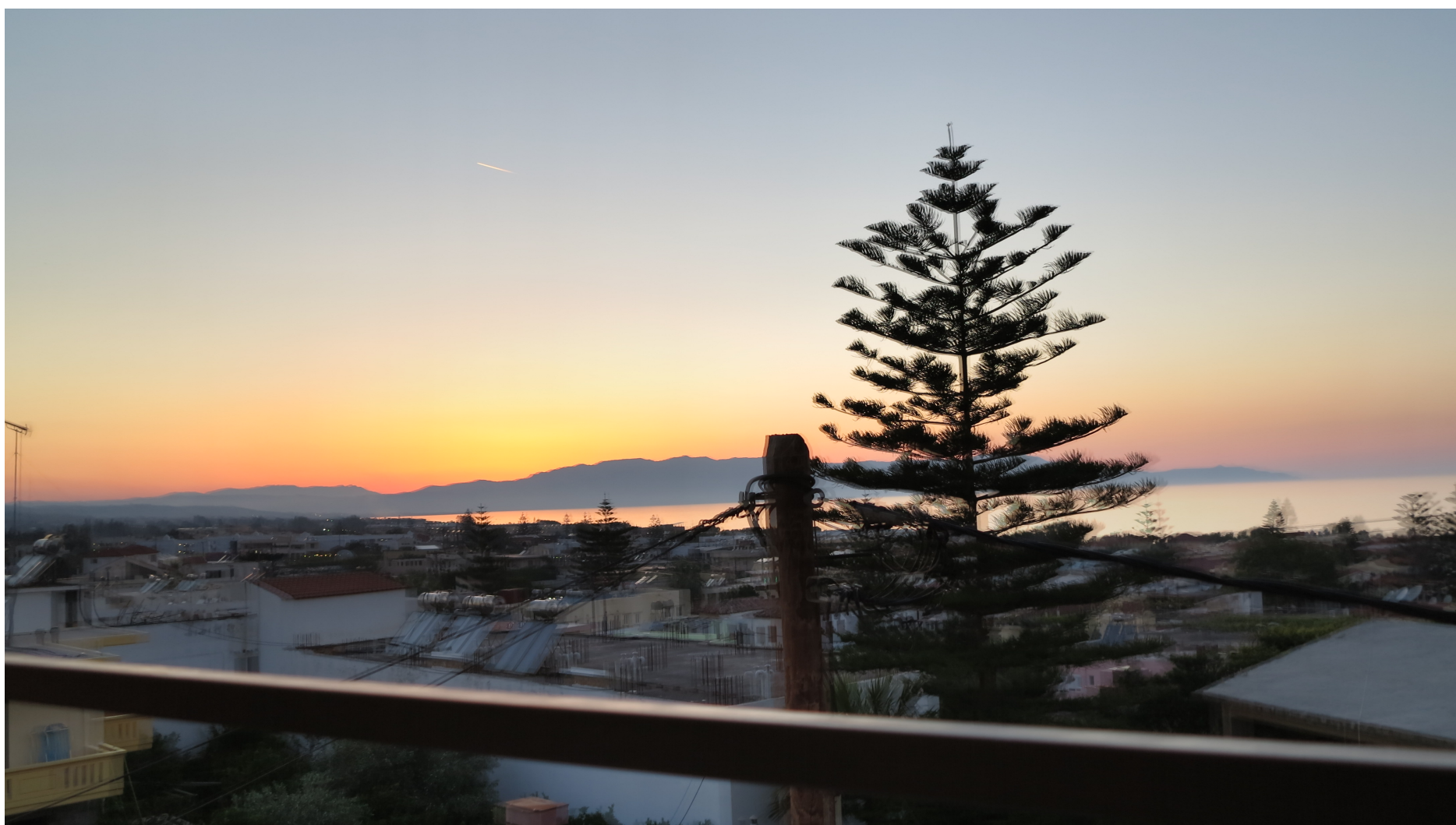
Solnedgang set fra Platanias.